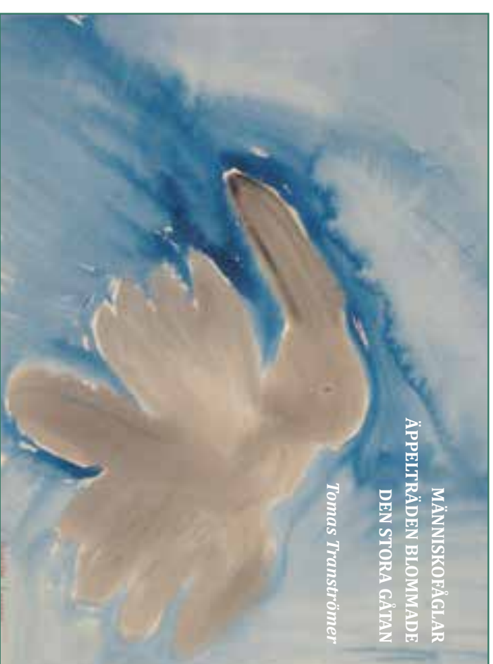
MÄNNISKOFÅGLAR DEN STORA GÅTAN Tommas Tranströmer